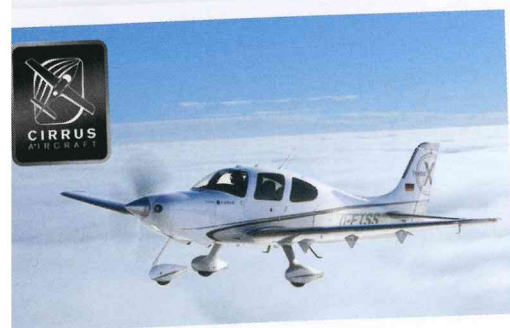
Cirrus Aircraft: frisches Kapital aus China