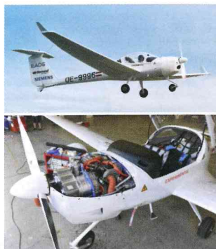
Doppelherz: Diamond DA-36 E-Star mit seriell-hybridem Antrieb

Auf der internationalen Luftfahrtmesse in Paris überraschte der österreichische Flugzeughersteller Diamond Aircraft mit einer Hybrid-Version seines Zweisitzers Super Dimona, der DA-36 E-Star. Der in Zusammenarbeit mit dem Luftfahrtkonsortium EADS und Siemens modifizierte Composite-Motorsegler ist das weltweit erste Flugzeug mit seriell-hybridem Antrieb. Während der Propeller von einem Siemens-Elektromotor mit 70 kW angetrieben wird, läuft ein Wankelmotor von Austro Engines mit niedriger Drehzahl permanent mit und dient ausschließlich als Stromerzeuger. Die Erfahrungen mit dem Technologieträger sollen in die Entwicklung größerer Hybrid-Luftfahrzeuge einfließen.