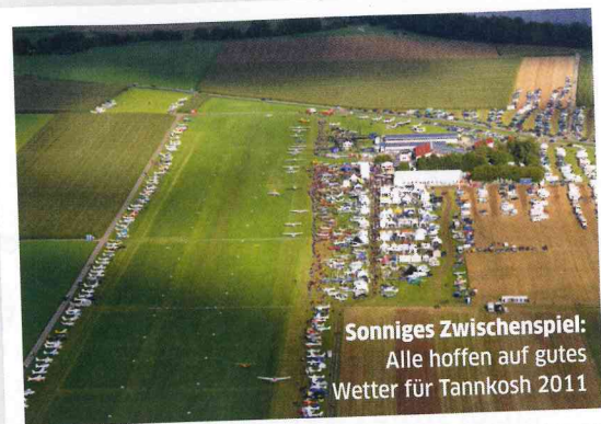
Sonniges Zwischenspiel: Alle hoffen auf gutes Wetter für Tannkosh 2011

AUGUST 2011 Es ist der Tannkosh-Monat – doch es gibt auch an anderen Flugplätzen viel zu sehen und zu erleben